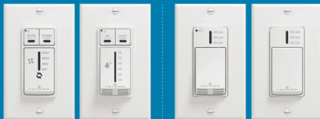
Commande automatique 41404